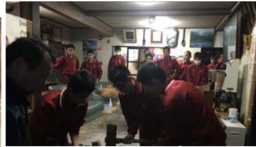
早朝もちつき大会 体力勝負です!!