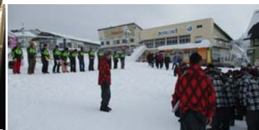
スキー・スノーボード 研修開校式

1月17日(火)～20日(金)の3泊4日の日程で修学旅行へ行きました。研修地は長野県飯山市にある戸狩温泉スキー場と、フジテレビ本社がある東京都港区台場です。4日間、全5講座のスキー・スノーボード研修を通して、今まで学んだことを活かし、集団行動の大切さなど学ぶことができました。また、今回生徒は、民宿に分かれて宿泊し、「もちつき」や「笹ずし」づくりを通して、宿の方々の温かさに触れることができました。今回の修学旅行で学んだことを、これからの学校生活に活かしてほしいと思います。