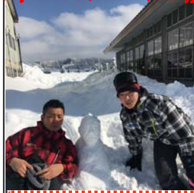
リアル雪だるま・モデルは誰だ!?

福岡県立糸島農業高等学校 ～「いのち」に学ぶ～ TEL 092(322)2654 FAX 092(323)5924