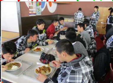
みんなで昼食タイム