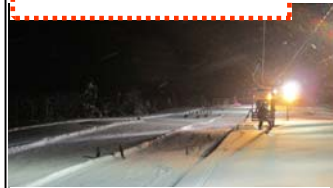
記憶に残った ナイタースキー