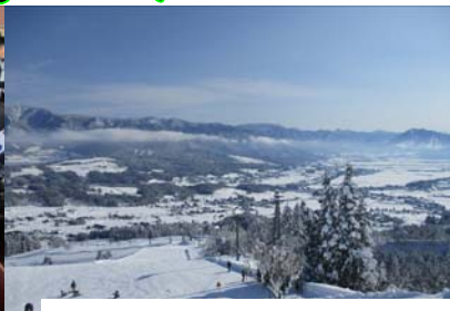
研修初日は快晴でした! 雪がまぶしい!!